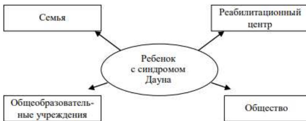
Рис. 1. Процесс социализации детей с синдромом Дауна, воспитывающихся в семьях, в условиях современного общества.

Ежегодно в России рождается около 2 тысяч детей с синдромом Дауна. Семьи, воспитывающие детей с синдромом Дауна, часто выделяются обществом в отдельный контингент населения, имеют проблемы в получении услуг в сфере образования и социального взаимодействия. В методических рекомендациях представлены структура и содержание психолого-педагогического сопровождения детей с синдромом Дауна и их семей в условиях социально-реабилитационного центра.